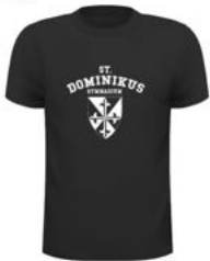
DENVER Basic Man T 15,00 €