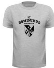
DENVER Basic Man T 15,00 €

Unsere neue Kollektion von H15 – dem führenden Schulshirt-Hersteller