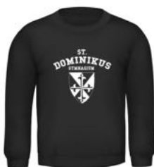
EDI Crew Neck Kids 21,00 €