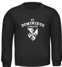
ENNO Crew Neck 25,00 €