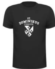
BUFFALO Basic Kids T 14,00 €