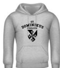
TORONTO Kapuzer 25,00 €