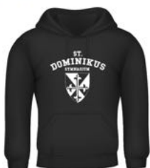
TORONTO Kapuzer 25,00 €