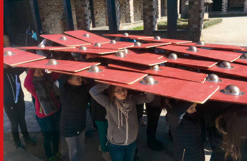
Der gemeinsame Start der Fächer Latein und Geschichte in Klasse 6 ermöglicht fächerübergreifende Zusammenarbeit und Projekte, z. B. die Exkursion zum Limeskastell Saalburg.