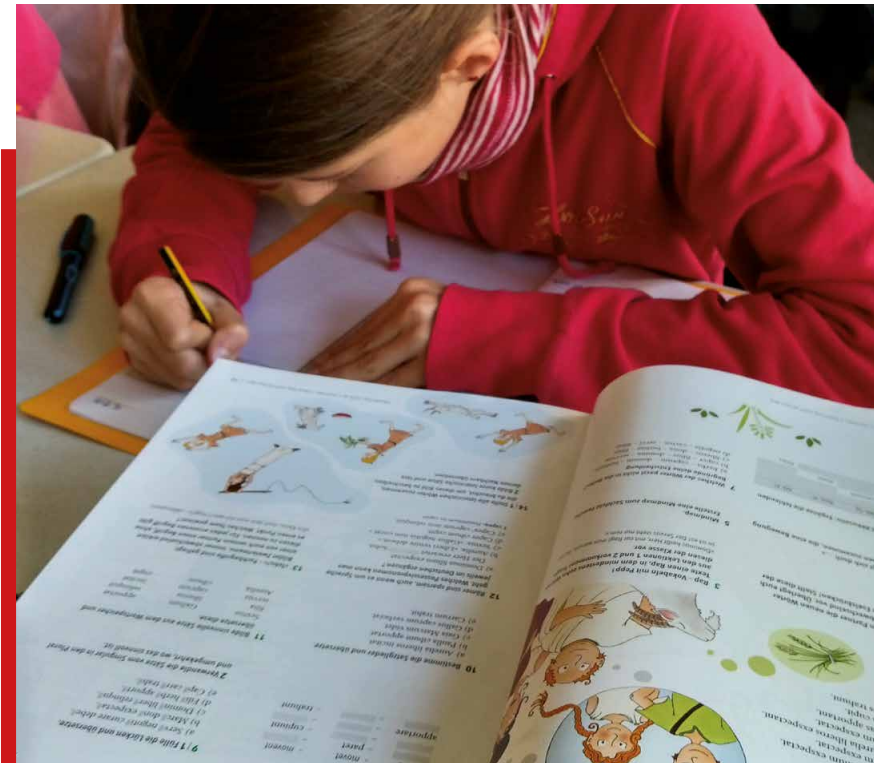
Wir arbeiten während der Spracherlernung mit einem anschaulichen und altersgerechten Lehrbuch.

Szenisches Spiel und kreative Projekte sind regelmäßige Bestandteile des Unterrichts und machen die Lebendigkeit und Aktualität des Lateinischen bewusst.